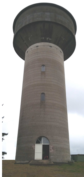
Château d'eau La Folie-Baugé

Rapport relatif au prix et à la qualité du service public de l'eau potable pour l'exercice présenté conformément à l'article L22245 du code général des collectivités territoriales et au décret du 2 mai 2007